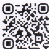
เอกสารที่เกี่ยวข้อง

สำนักงานปลัดกระทรวงการคลัง จะแจ้งรายชื่อผู้ผ่านการคัดเลือกผ่านทาง เว็บไซต์ https://hr.mof.go.th/th ภายใต้หัวข้อ “นักศึกษาฝึกงาน” ในวันที่ ๑ มีนาคม ๒๕๖๗