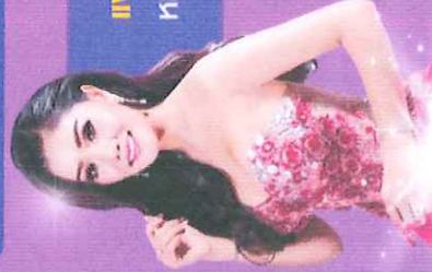
แพรวพราง แสงทอง หมอลำไฉฉอ ชื่อดัง

เคล็ดลับดี ๆ โดนๆ ของการผลิตสื่อสร้างสรรค์ จากสุดยอดนักสร้างสรรค์ชื่อดัง พร้อมแรงบันดาลใจ แบบ Exclusive กับ นักเขียนมือทอง หมอลำไฉฉอชื่อดัง และ นักวิชาการ ที่เกี่ยวข้อง